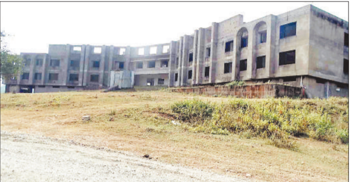
ऊपर-प्रस्तावित प्रशासनिक भवन एवं नीचे निर्माणाधीन भवन।

चार साल से राशि का इंतजार भवनों का निर्माण पूरा नहीं होने से विवि की शैक्षणिक गतिविधियां ठप हो गई हैं। अधूरे भवनों के निर्माण के लिए 24.35 करोड़ एवं सड़क निर्माण के लिए 26 करोड़ रूपए की जरूरत है। विवि प्रबंधन इस बड़ी समस्या के निराकरण के लिए लम्बे समय से शासन स्तर के अधिकारियों को स्थिति से अवगत करा रहा है। विवि के विकास में क्षेत्र के जनप्रतिनिधियों की रुचि नहीं है। जनप्रतिनिधियों पर बीच-बीच में विवि के हितों की उपेक्षा करने के भी आरोप लगते रहे हैं। इस बार के बजट में विवि के अधूरे भवनों के निर्माण के लिए राशि मिलने की उम्मीद जताई जा रही थी लेकिन शासन द्वारा बजट में राशि का प्रावधान नहीं किया गया है। ऐसे में निकट भविष्य में अधूरे भवनों का निर्माण पूरा होने की संभावना नहीं है।